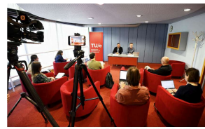
Hoe TU/e een gigantische cybercrisis voorkwam met een drastische beslissing